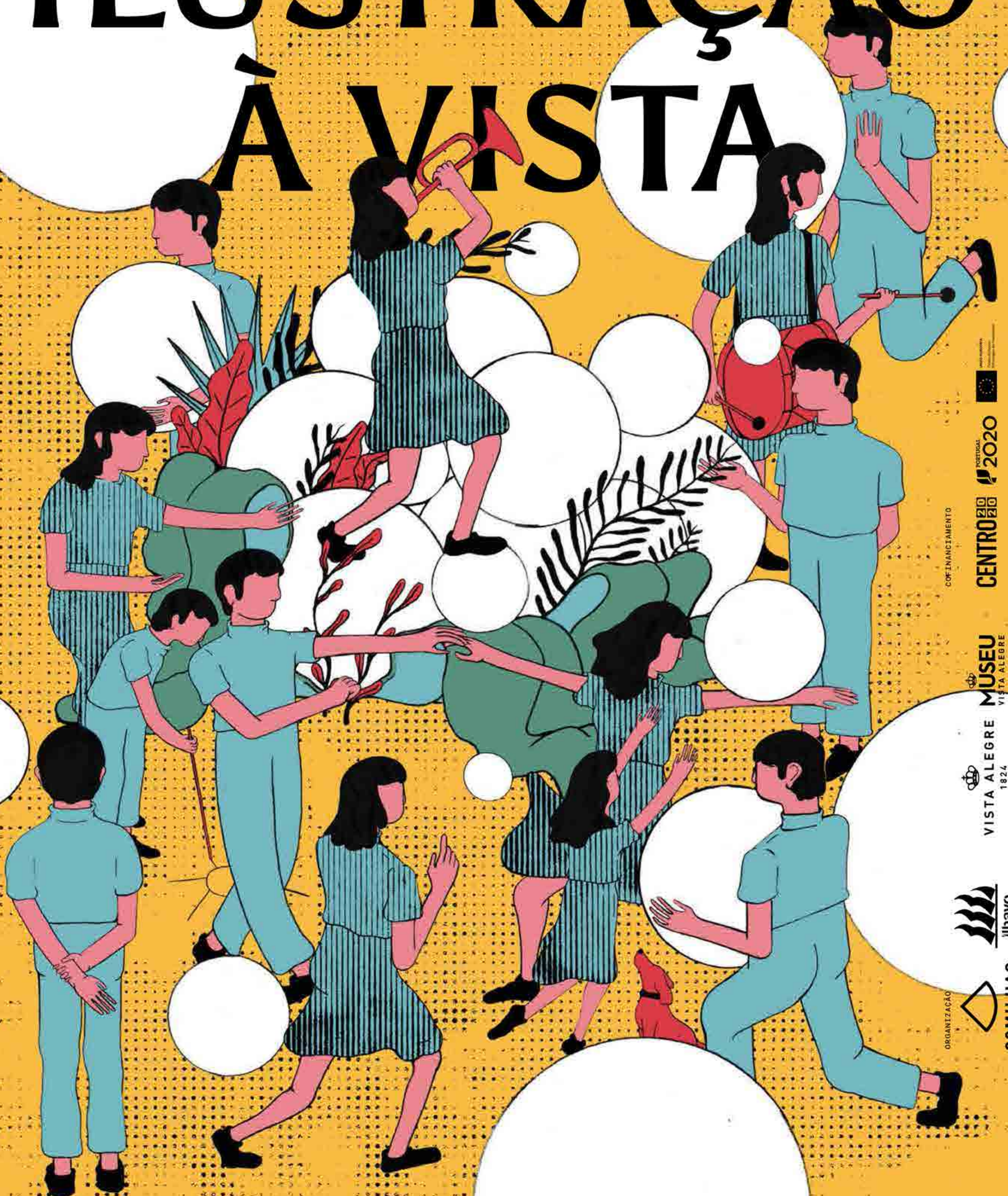
ILUSTRAÇÃO À VISTA

Dança, Teatro de rua, Música, Exposições, Cinema, Oficinas